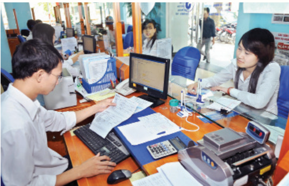
Năm 2015, ngành Tài chính đã giảm thêm được 50 giờ nộp thuế, đưa tổng số giờ nộp thuế xuống còn 117 giờ, vượt mục tiêu đề ra.

Bên cạnh đó, Tổng cục Thuế đã nâng cấp các ứng dụng (QHS, QLCV, QTT...) để quản lý, theo dõi việc nhận, trả hồ sơ hành chính thuế theo chế độ một cửa, đảm bảo việc giải quyết hồ sơ thuế của cơ quan thuế các cấp