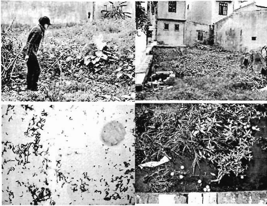
Hình 3. Ứng dụng chế phẩm bánh lãi ngô diệt bọ gậy trong ao hồ tại quận Thanh Xuân, Hà Nội

Hiệu quả diệt bọ gậy được nêu trong bảng 6. Sau 72 giờ xử lí, tỉ lệ bọ gậy ở các ao đều giảm từ 90,8 đến 100%. Ao đối chứng 1 là ổ nhân tạo, bọ gậy được thả vào bể nước bỏ không, trước đó không có bọ gậy và trứng muỗi. Trong các ngày tiến hành thí nghiệm, bọ gậy nở thành quăng và thành muỗi mà không có lúa bọ gậy kề cận, do vậy mật độ giảm dần. Ở ao đối chứng 2 (thù vực tự nhiên đã có sẵn bọ gậy các tuổi và trứng muỗi), mật độ bọ gậy tiến triển theo hướng tự nhiên.