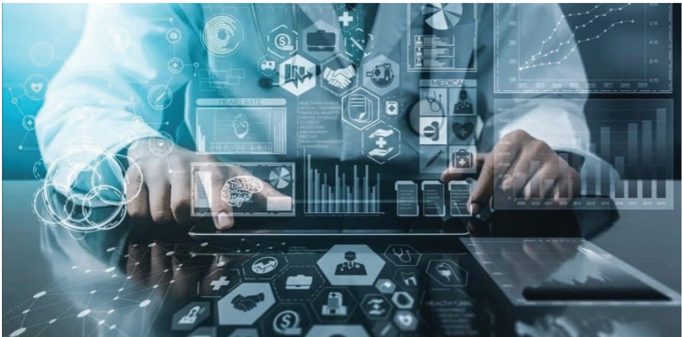
Nhiều doanh nghiệp dù đã được cấp giấy chứng nhận doanh nghiệp khoa học và công nghệ nhưng chưa thể thụ hưởng đầy đủ các chính sách ưu đãi. Ảnh minh họa.

Bên cạnh đó, khả năng tiếp cận nguồn vốn ưu đãi, đặc biệt là trong giai đoạn đầu tư nghiên cứu và hoàn thiện sản phẩm vẫn còn hạn chế. Hoạt động nghiên cứu và phát triển đòi hỏi nguồn lực dài hạn trong khi các quỹ hỗ trợ hiện nay chưa đáp ứng đủ về quy mô, điều kiện tiếp cận chưa thực sự phù hợp với thực tiễn hoạt động của doanh nghiệp.